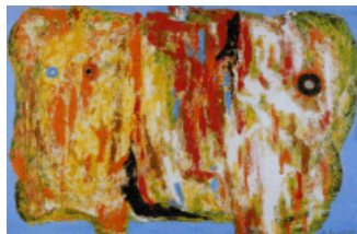
Картина Белютина "Крестьянские девушки", 1960 г.

Элий (Елигий) Белютин (1925 – 2012 гг.). Художник- авангардист, видный представитель советской творческой интеллигенции. С 1954 г. работал преподавателем в Полиграфическом институте; в 1958 г. уволен, и перешёл Всесоюзный институт ассортимента изделий легкой промышленности и культуры одежды. Его студенты рисовали на любых поверхностях практически всеми возможными инструментами, включая швабры и гвозди.